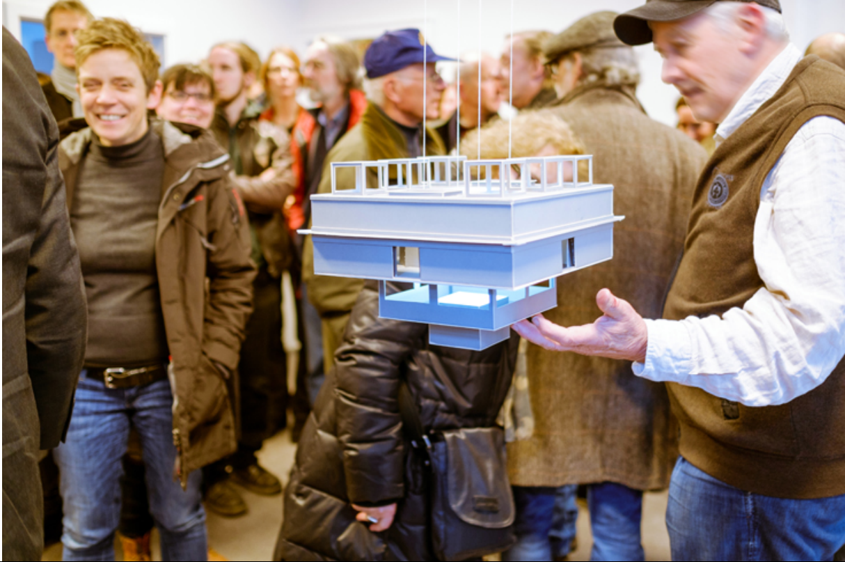
Candia Neumann „arthouse“ 2015 Modellbaukarton 30 cm x 30 cm x 30 cm