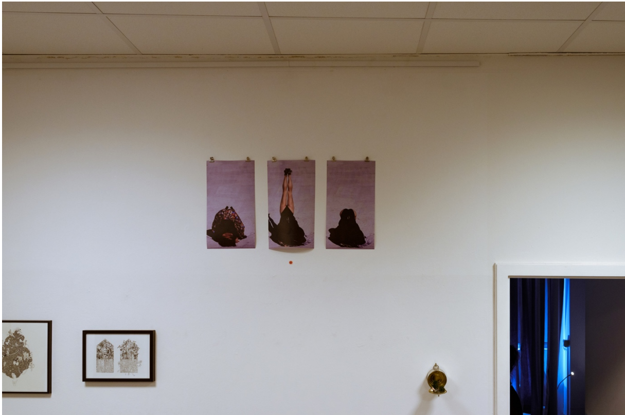
Anke Gollub (oben/mitte)