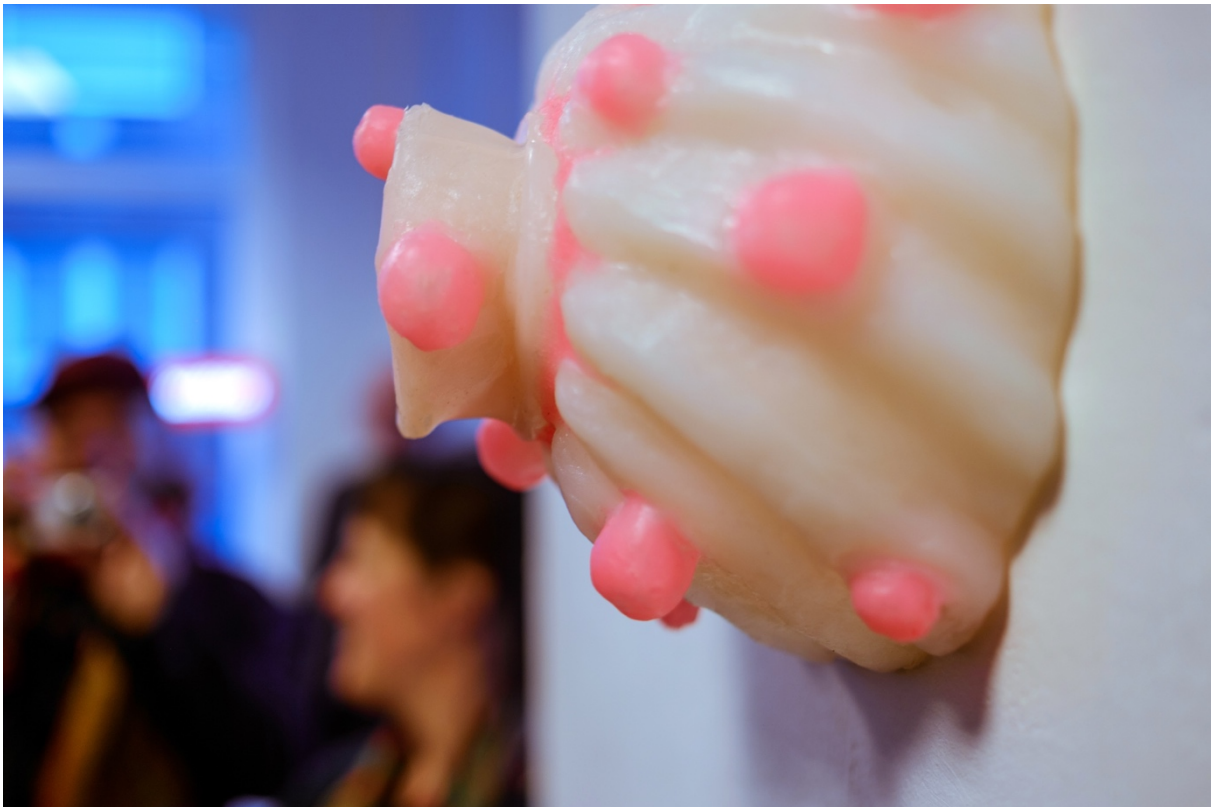
Barbara Koch „Lab Sweets (Small Beasts) # 7“ 2014 Silikon, fluoreszierende Pigmente Ø ca. 24 cm/Höhe ca. 15