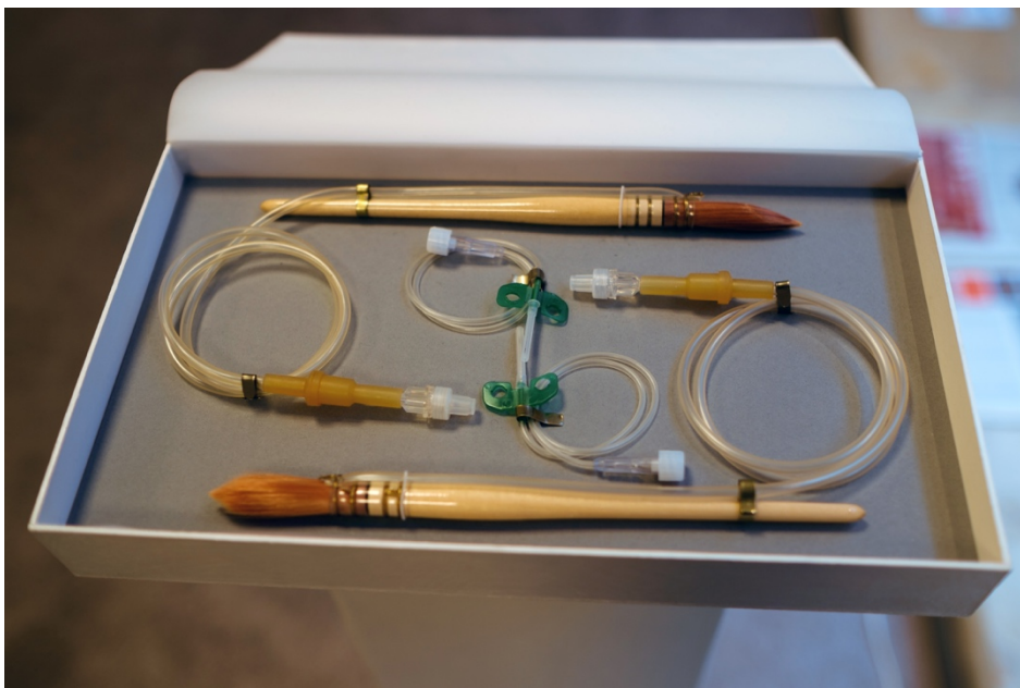
Candia Neumann