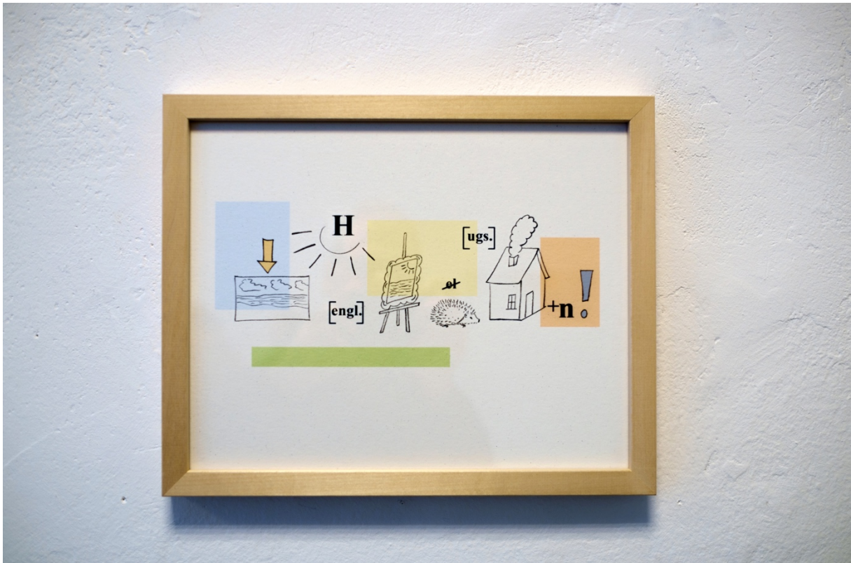
Michael Müller

Dosen Durchmesser 80 mm, Konservendose D=80 mm, Figuren und Gegenstände aus dem Modelleisenbahnbereich in der Größe "Spur N"