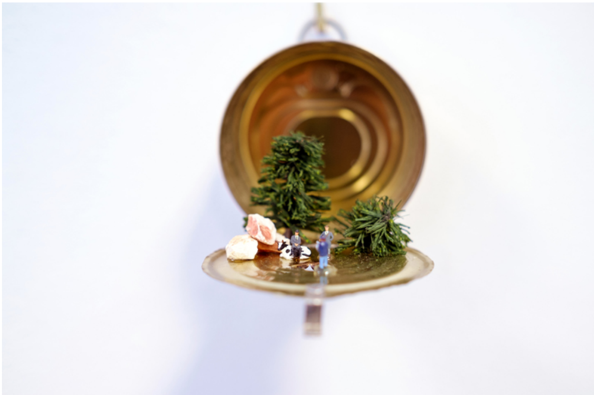
Ivo Weber